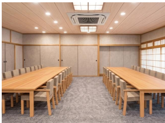
大和棟「松の間」完成イメージ

最大32名様までご利用いただける「松の間」と、ご法要専用の25名様向け個室「竹の間」を設け、ご会食やご宴席、ご法要など、さまざまなお集まりにご利用いただける空間として装い新たに生まれ変わります。