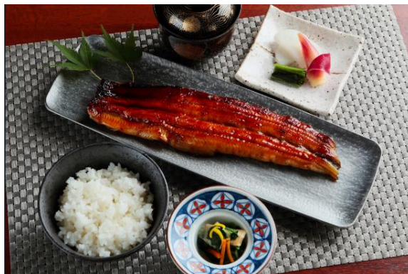
鰻御膳 ご飯、吸物、香の物付 5,000 円（税込）