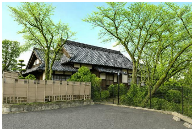
あやめ館大和棟 完成イメージ