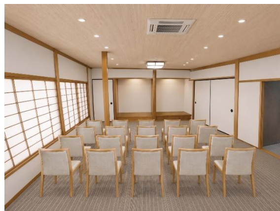
大和棟「竹の間」完成イメージ