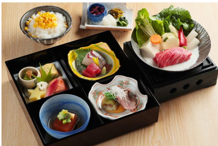
プレ内覧会限定御膳イメージ