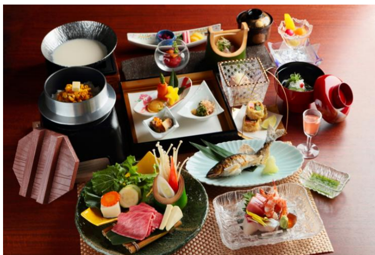
「創業100周年記念会席」イメージ