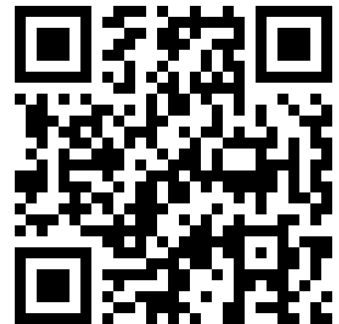
販売ページ 読み取りコード