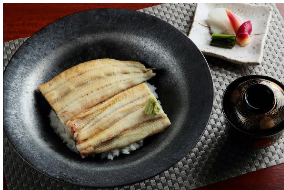
鰻白焼丼 吸物、香の物付 5,000 円（税込）