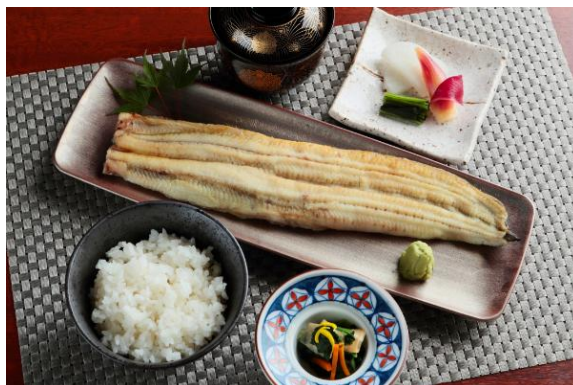
鰻白焼御膳 ご飯、吸物、香の物付 5,000 円（税込）