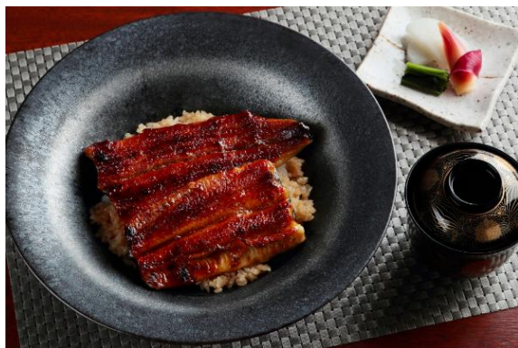
鰻丼 吸物、香の物付 5,000 円（税込）