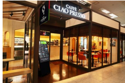
■カフェチャオプレッソ上本町駅店外観