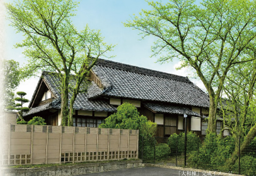
「大和棟」完成イメージ