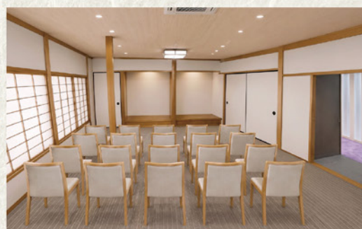
大和棟「竹の間」完成イメージ