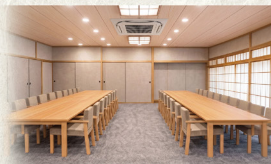
大和棟「松の間」完成イメージ