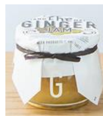
UNE TABLE ジンジャージャム 320円