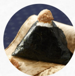
たらこ Cod Roe N ¥270