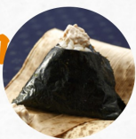
ツナマヨネーズ Tuna Mayonnaise L ¥230