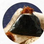
かつお Bonito Flakes B ¥230