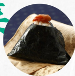
紀州梅 Dried Plum E ¥260