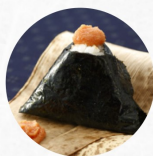
からし明太子 Spicy Cod Roe D ¥240