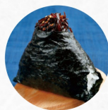
細切りごま昆布 Shredded Sesame Kelp S ¥260