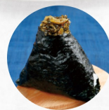
醤油炒め高菜 Stir-Fried Takana With Soy Sauce Q ¥230