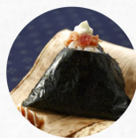
まぐろわさびマヨ Tuna Wasabi With Mayonnais R ¥290