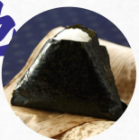
塩にぎり Salt A ¥170