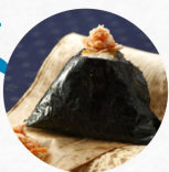
鮭ほぐし Salmon Flakes C ¥260