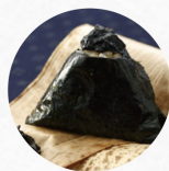
わさび昆布 Wasabi Kelp F ¥240