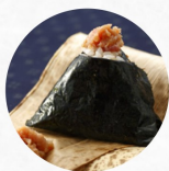
まぐろ Tuna I ¥280