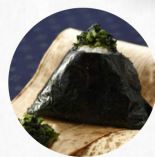
青しそ高菜 Pickled Takana Mustard With Perilla K ¥230