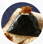
ちりめん山椒 Small Dried Sardine With Sansho Pepper H ¥260